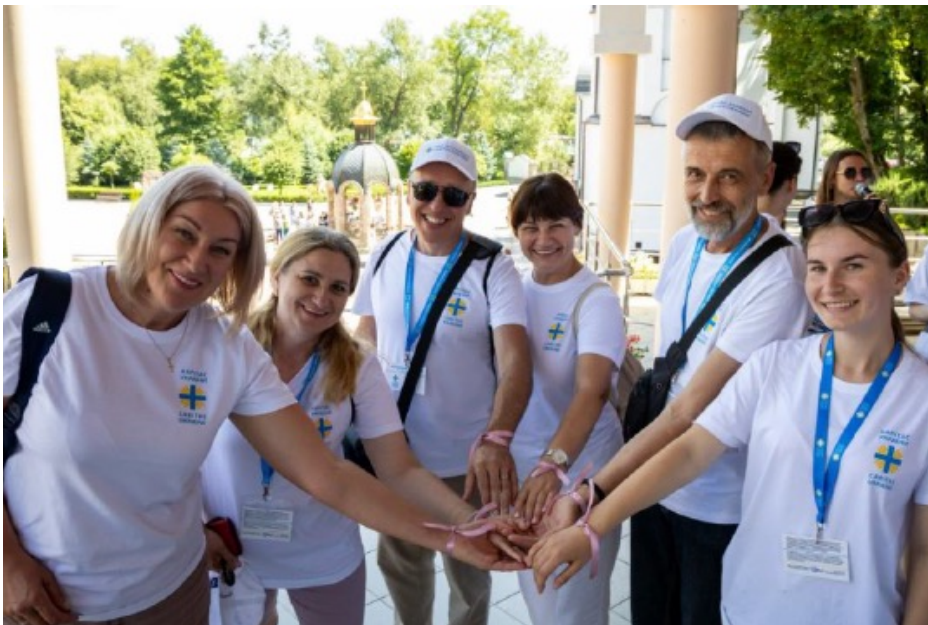
Фото 3. Волонтерська проща, 2025 рік.