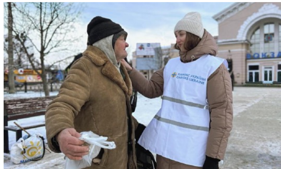
Фото 6. Команда Карітас Полтава підтримує людей у потребі гарячим чаєм та теплим спілкуванням під час сильних морозів, 2025 рік