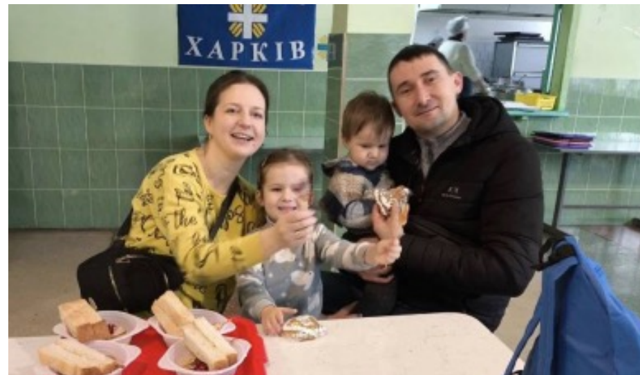
Фото 2. Команда благодійної кухні Карітас Харків готує святкове різдвяне меню для людей, евакуйованих через обстріли, у межах гуманітарного проекту, м. Харків, за підтримки Catholic Relief Services (CRS), 2025 рік