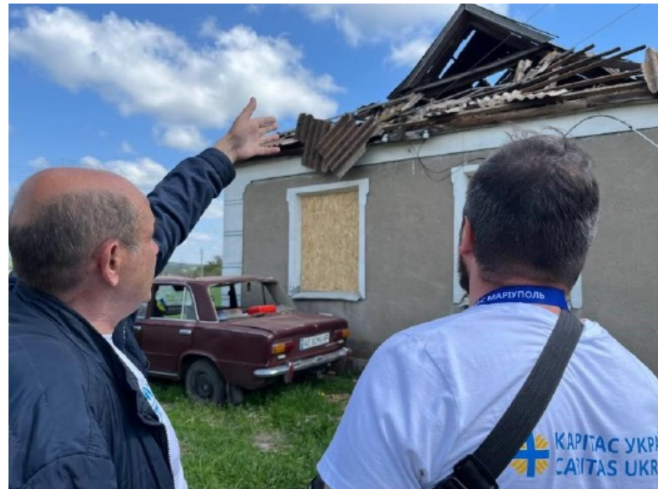
Фото 5. Реєстрація на проведення ремонту в межах проекту УВКБ ООН (UNHCR), Карітас Маріуполь у Дніпропетровській області, 2025 рік