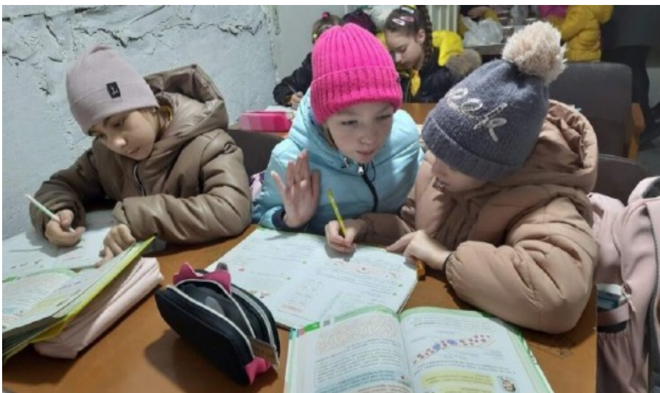
Фото 4. Діти з числа місцевих мешканців та внутрішньо переміщених осіб під час занять у Просторі, дружньому до дітей Карітасу Краматорськ у м. Жовті Води, 2025 рік